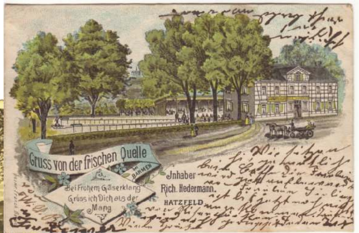
Postkarte mit Poststempel vom 18.08.1897