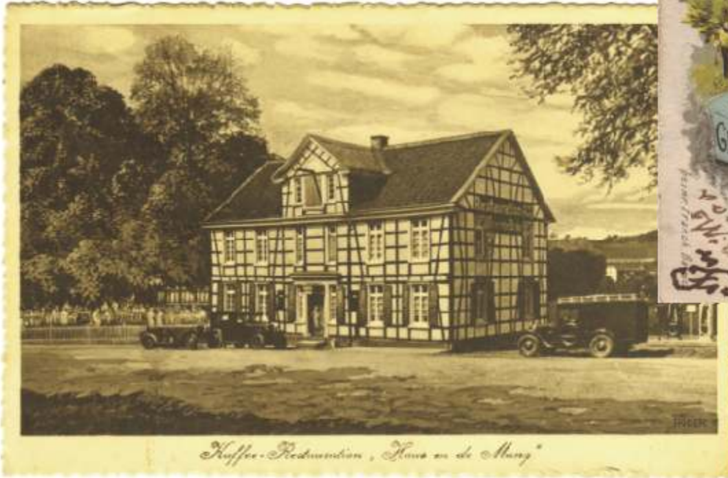
Postkarte mit Poststempel vom 28.01.1935