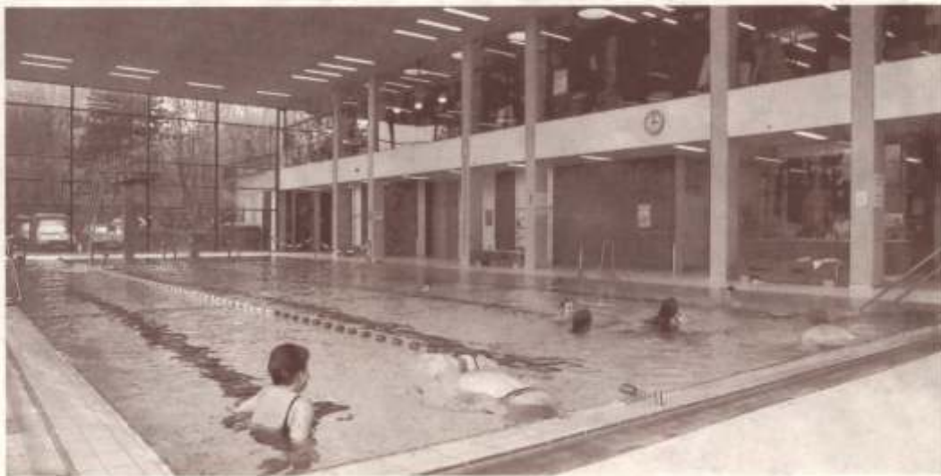
Das Schwimmbad, hier ein Archiv-Foto, soll nach der Renovierung voraussichtlich Mitte Juli wieder geöffnet werden.

Denn für die Öffentlichkeit ist im frisch renovierten Bad – mit dem Ende der Arbeiten wird Mitte Juli gerechnet – nur das morgendliche Zeitfenster zwischen 6.45 und 9 Uhr reserviert. Besuchern steht das Bad außerdem freitags von 17 bis 21 Uhr offen. Während der restlichen Zeit sei die Anlage quasi komplett belegt, erklärt Bernd Bever vom städtischen Sport- und Bäderamt: Morgens ab 8.30 Uhr werden Schüler am Uellendahl erwartet, wöchentlich sind 52 Schulstunden eingeplant. Dem Vereins-sport ist das Bad montags von 18